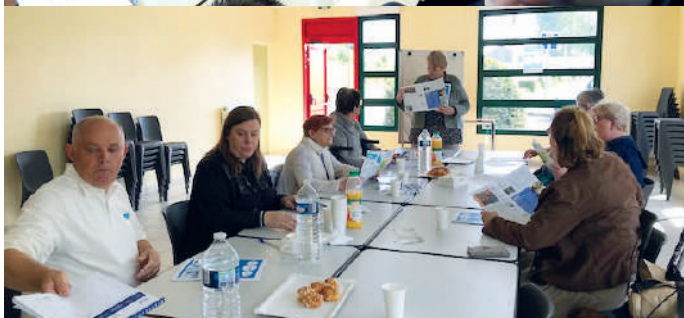
Avion, Liévin, Méricourt, Loos-en-Gohelle

1 re réunion d’échanges d’idées, de projets avec nos locataires seniors qui souhaitent s’investir dans la vie de leur résidence. Nouveaux services, activités loisirs, prévention santé et lutte contre la fracture numérique sont autant de projets qu’ils souhaitent développer afin de préserver leur autonomie.