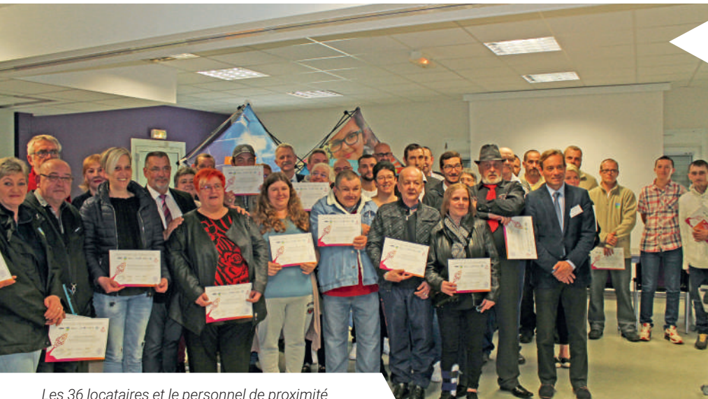
Les 36 locataires et le personnel de proximité de Pas-de-Calais habitat, pionniers dans le concept d'Habitat contributif.

Judi 25 avril, 36 locataires des communes de St-Martin-Boulogne et Outreau ont été mis à l'honneur lors d'une réception en présence des partenaires et du bailleur anglais OPTIVO.