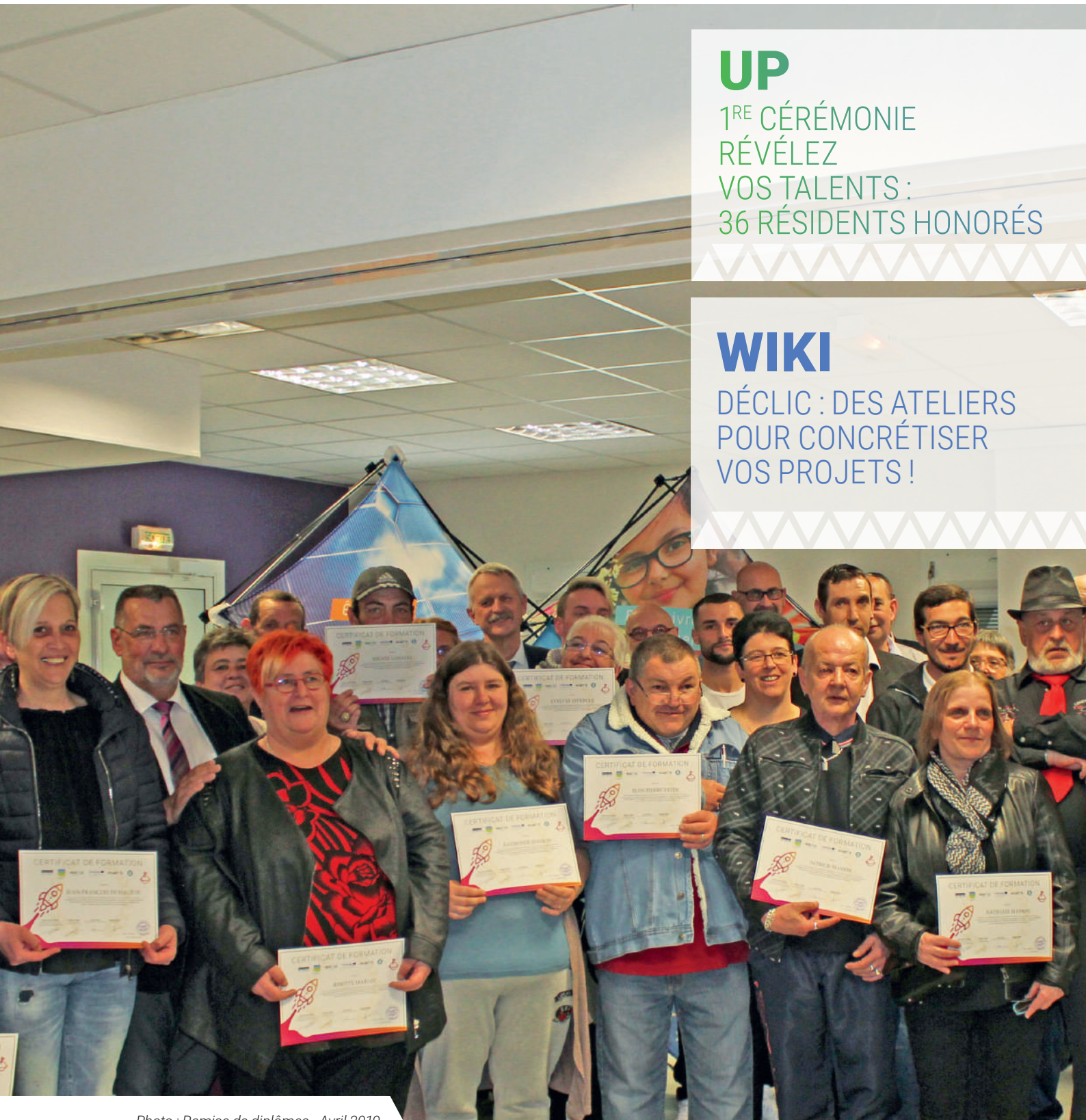
Photo : Remise de diplômes - Avril 2019

DÉCLIC : DES ATELIERS POUR CONCRÉTISER VOS PROJETS !