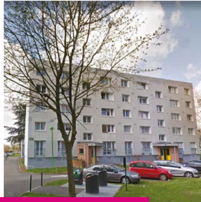
La place de Rouen bientôt réaménagée.

Avec les travaux, l'entretien des parties communes au sein des résidences du quartier est aussi renforcé.