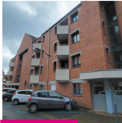
La rue du Pré au cœur du quartier Méaulens.

Ces rénovations contribuent à améliorer le confort des locataires et rendent aussi le quartier plus attrayant.