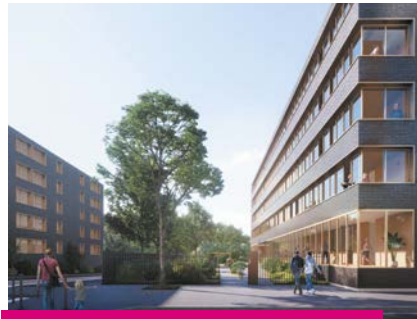
La résidence autonomie du Domaine du Prieuré, aux 24 et 25 rue de Budapest.

D'autres interventions, entrant dans le cadre de l'entretien courant cette fois, sont également programmées cette année : remise à neuf de l'entrée, remplacement des portes des appartements et des chauffe-bains au 17 rue de Schwerte , rénovation des canalisations d'alimentation en eau du 9 boulevard de Varsovie , remplacement des chauffe-bains au 1 et 2 avenue du Mont Liébaut , réfection de la toiture-terrasse du 1A avenue de Madrid et remise en peinture des halls d'entrée de divers bâtiments du quartier.