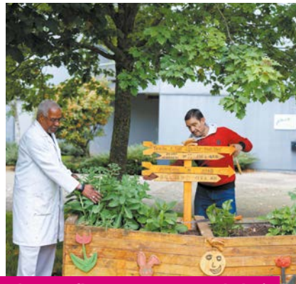
Des bacs à fleurs, créés avec du bois récupéré, agrémentent joliment la résidence.

Faites part de vos idées à votre gardien ou à votre responsable d'agence : ils peuvent vous aider à concrétiser votre projet.