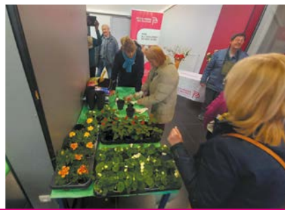
Un moment fleuri à la Tour Verlaine.

Les actions proposées par Pas-de-Calais habitat vous sont communiquées via des affiches apposées dans le hall d'entrée de votre résidence. Venez partager des moments conviviaux à nos côtés !