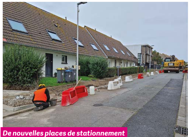
De nouvelles places de stationnement ont été créées rue Alphonse Daudet et Sœur Renée Tack.

Dans le cadre de son partenariat avec la Ville du Portel et grâce à la convention d'abattement de la Taxe Foncière sur les Propriétés Bâties (TFPB) accordée aux bailleurs sociaux, Pas-de-Calais habitat s'engage activement dans la transformation des quartiers.