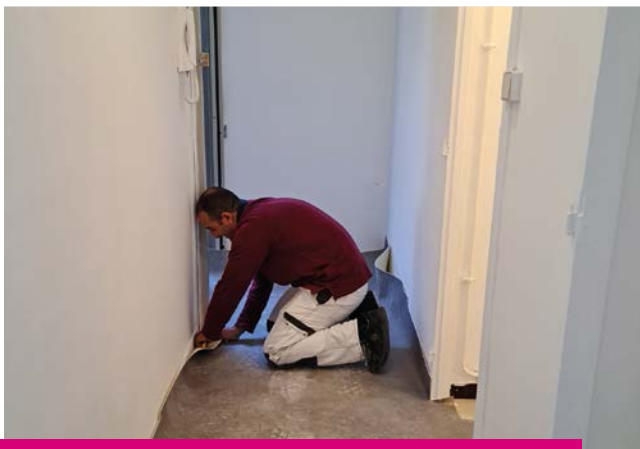
Les chantiers d'insertion réalisés en 2025 par l'association Cré'actif ont permis la rénovation complète de 6 logements au Portel.